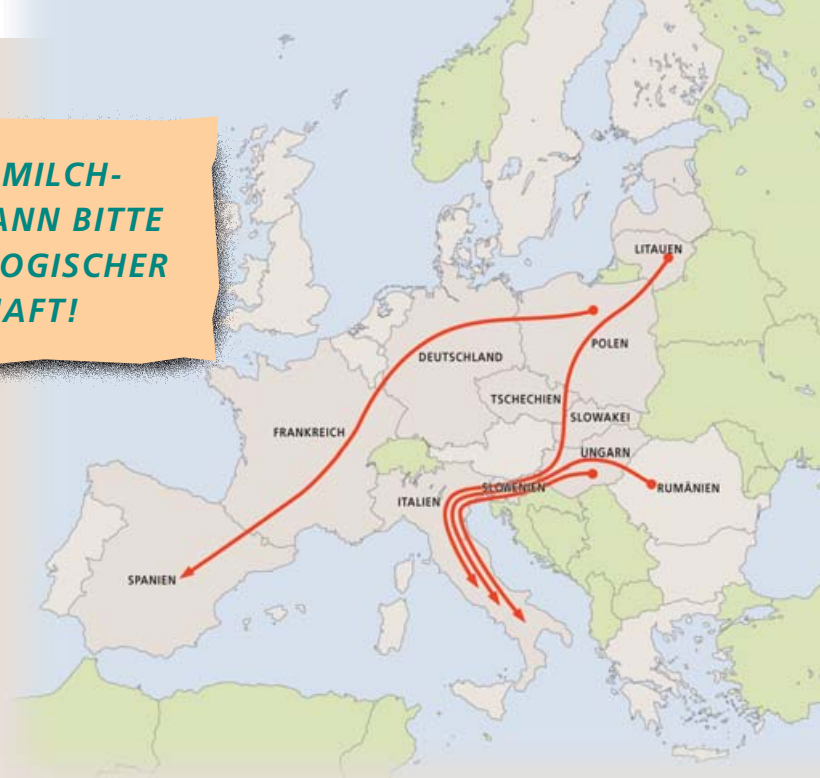
Einige der Hauptrouten für Kälbertransporte

Die gesetzlichen Rahmenbedingungen für Tiertransporte in der EU wurden in einer neuen Richtlinie vom November 2004 festgeschrieben. Danach dürfen Tiere noch immer bis zu 29 Stunden in einem Stück transportiert